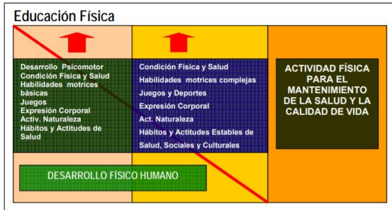
Figura 3. Cultura Física Educación Física. Dos modelos didácticos. Vizúete (2003).

En el caso de esta figura, se pueden apreciar los niveles menores a que se hizo referencia y que de alguna forma se definen como fines o metas parciales o específicos de acuerdo con el aspecto que se pretende desarrollar; lo cual podrá apreciarse en el diseño de los planes y programas de estudio así como en las planeaciones didácticas a través de las cuales se pretenda concretar esta intención pedagógica.